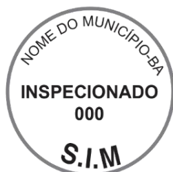
Modelo 4: 5cm de diâmetro