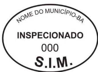
Modelo 1: 7x5cm