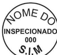
Modelo 3: 4cm de diâmetro