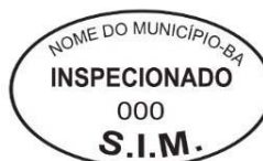
Modelo 2: 5x3cm