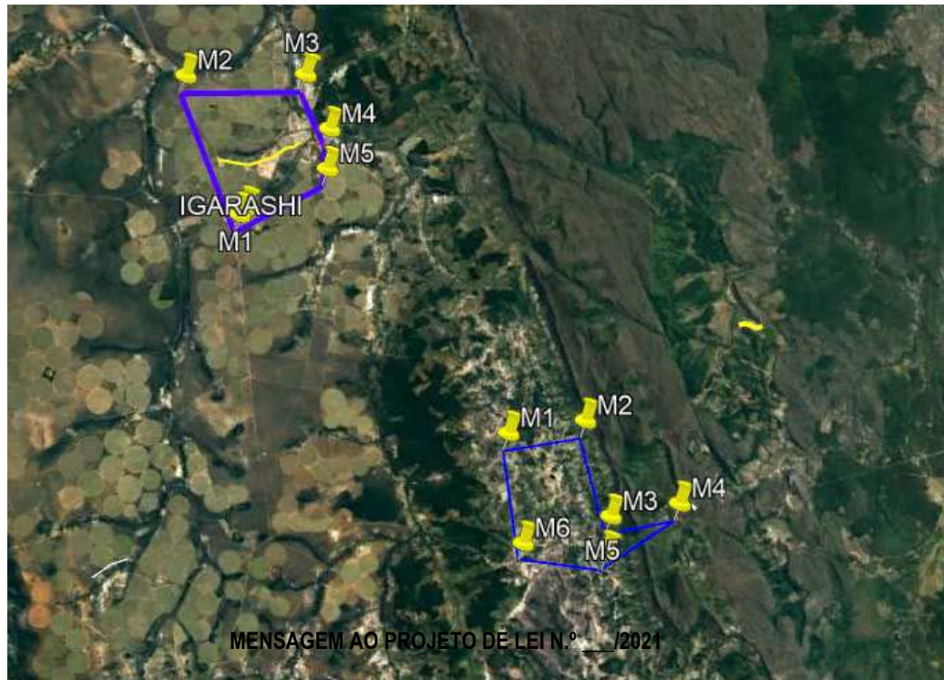
Foto área do município.

Praça Américo Martins Junior, S/N, Centro, Ibicoara-BA CEP 46.760-000 Tel. (77) 3413-2199